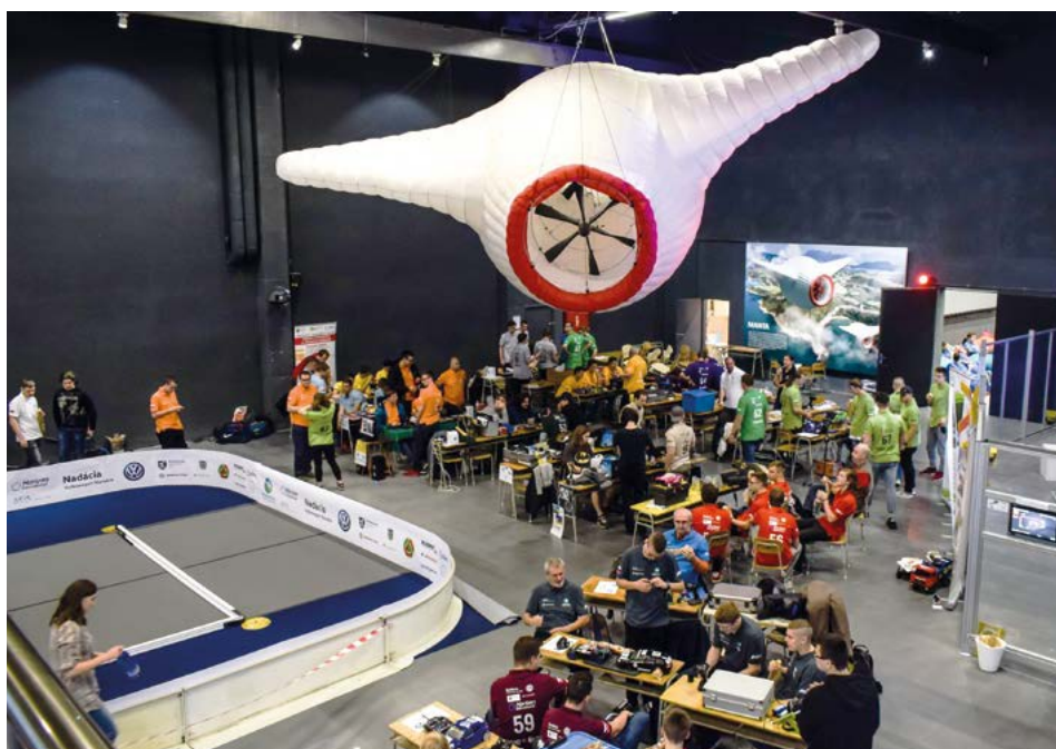
Autíčko na vodíkový pohon z dielne budúcich strojárrov odjazdilo 686 kôl, palivo mu vydržalo 5 hodín a 52 minút a umiestnilo sa na 3. mieste medzi novými účastníkmi (celkovo na 5. mieste).