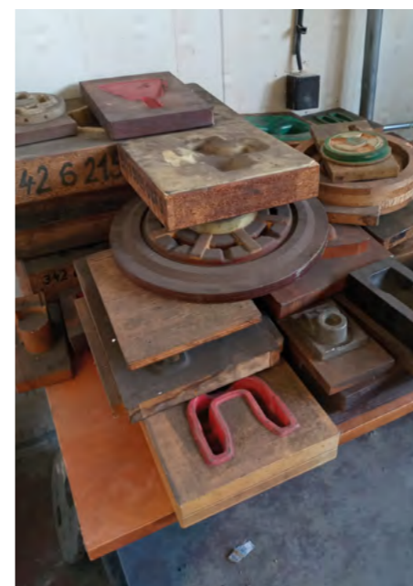
Tieto formy na výrobu náradia pochádzajú z konca 80. a začiatku 90. rokov minulého storočia.

kutia.“ V 90. rokoch sa technológie výrazne posunuli dopredu a konštruktéri v kováčni začali pracovať s prvým počítačom. Náradie už nemuseli kresliť na výkres, navrhovali ich v programe, najskôr v 2D a neskôr v 3D zobrazení. Výkres sa síce používa dodnes, no je už len sprievodnou dokumentáciou.