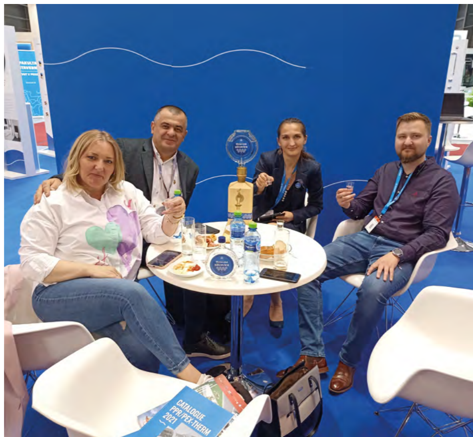
Návšteva majiteľov srbskej spoločnosti Neša komerc.

Na budúci rok je naplánovaný veľtrh Aquatherm na Slovensku, na Agrokomplexe v Nitre. Slovarm bude opäť pri tom.