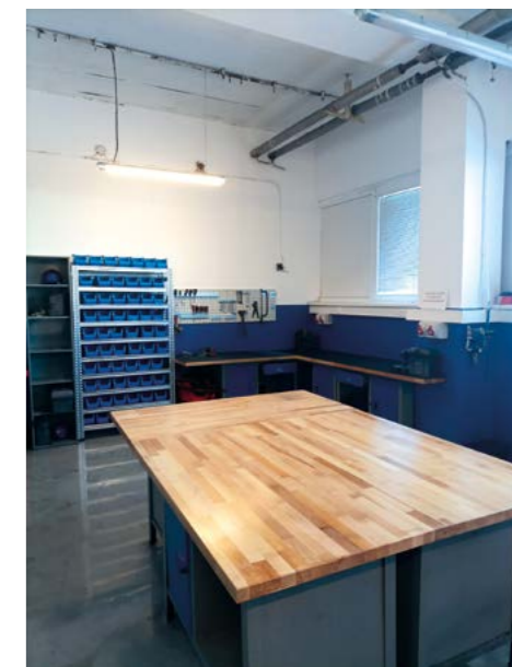
Pracovisko elektroúdržby dnes